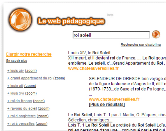
Illustration du site lewebpedagogique.com

Les propositions de l'agent Related Topic Engine sont d'autant plus pertinentes, qu'elles sont déterminées automatiquement et dynamiquement en fonction des réponses fournies lors de la première recherche de l'internaute. Elles permettent à l'internaute de naviguer parmi des groupes de réponses et, très rapidement , d'atteindre LA bonne réponse à sa question.